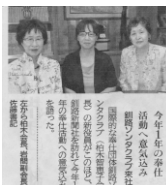
※釧路新聞取材記事