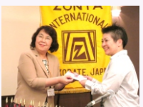
ピンゴ賞大当たり。