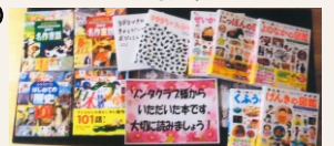
芦野小学校図書委員会