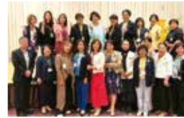
北陸三県のZC集合写真 エリアミーティングにて