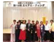
エリアミーティング