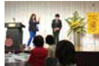
エマLコンロン地区賞授賞式

4/7 理事会 4/21 例会 アースデーに因んでレクチャー 4/25 TOYAMA ZC 認証伝達式(4名参加) 4/28 理事委員長会議 総会に向け活動報告・決算報告の確認 5/7 理事会 5/12 次期理事委員長会議 総会に向け活動案・予算案の検討 5/17 エリア3エリアミーティング(17名参加) 次回EMご案内 5/19 総会資料印刷・発送 5/23 総会 5/24 エリア2エリアミーティング(3名参加)