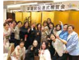
TOYAMA ZC 認証状伝達式