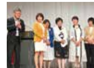
エリアミーティング