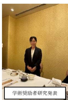
学術奨励者研究発表