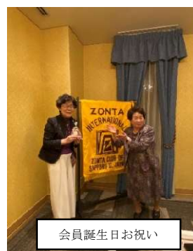
会員誕生日お祝い