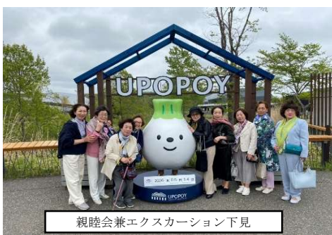
親睦会兼エクスカッション下見