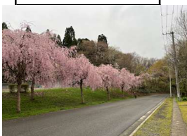
創立10周年の時に記念植樹したしだれ桜がきれいに育って 桜並木になりました（秋田市 一ツ森公園）