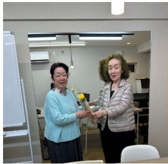
徳中会員誕生祝いに黄色のバラ