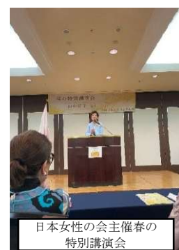
日本女性の会主催春の特別講演会