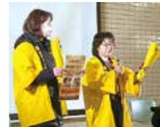
イベント来場者へ ソント活動をPR