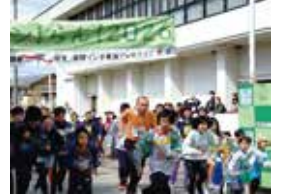
社会福祉センターを走ろう RUN!ラン!らん!