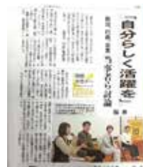
ローズデーイベント