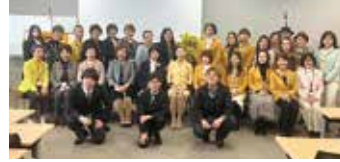
ローズデー記念講演会