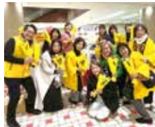
3/14 ローズデー ソントブースにて