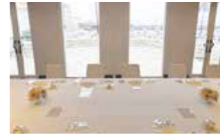
30周年記念祝賀会会場