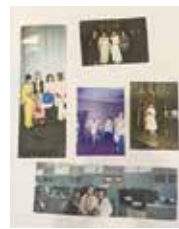
和歌山ゾンタクラブの歴史を振り返りました