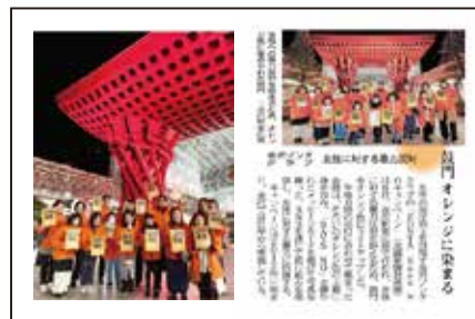
12/6 ZONTA Says NOキャンペーン