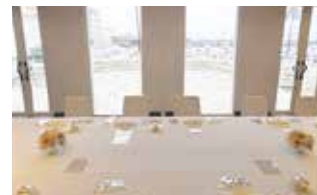
30周年記念祝賀会会場