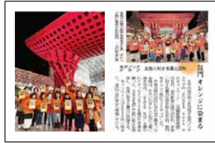
12/6 ZONTA Says NOキャンペーン