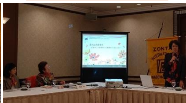
[名古屋 SORA] オレンジ キャンペーン 卓話