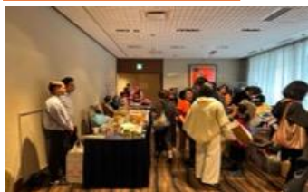
[東京 I] 第 59 回ギフトフェア