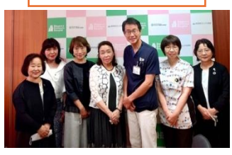
[松本]寄付先訪問 長野県立子ども病院