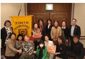
[名古屋 SORA] オレンジ キャンペーン 例会にて