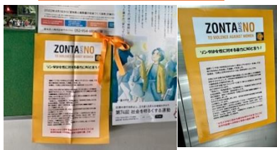
[東京 III] オレンジ キャンペーンポスター