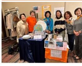
[東京 III] 東京 I のパザールに出店