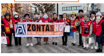
[松本] オレンジ キャンペーン