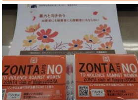
[名古屋 SORA] オレンジ キャンペーン ティッシュ配布