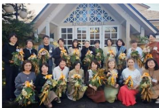
[松本] オレンジ キャンペーン例会にて