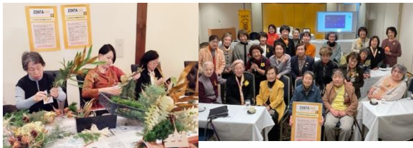
[山梨]オレンジ キャンペーン リボンで Xmas スワッグ