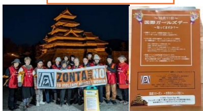
[松本]オレンジ キャンペーン 松本城ライトアップ