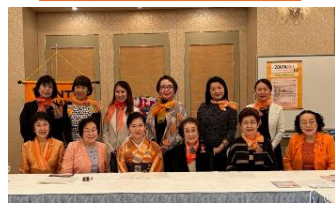
[岐阜] オレンジ キャンペーン例会にて