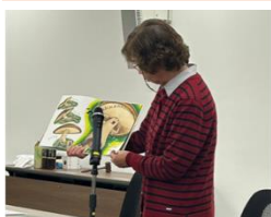
[三重] 第 35 回研修会