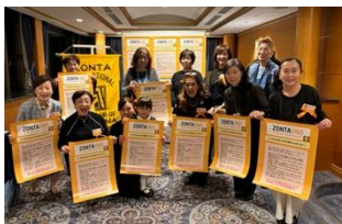
[横浜] オレンジ キャンペーン例会にて