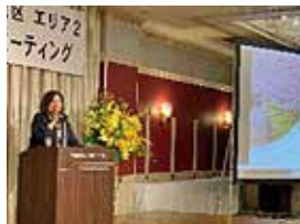
エリア2 エリアミーティング