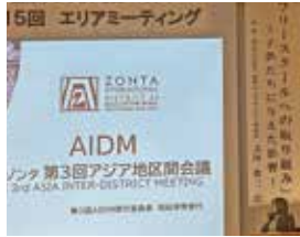
エリア1 エリアミーティング