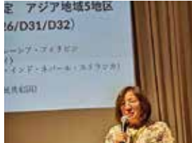
エリア4 エリアミーティング

他の地域に負けないう、26地区が強力なリーダーシップを取って、第3回AIDMを皆で成功させましょう! 26地区から、すべての会員の皆様の参加をご期待いたします。