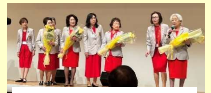
東京IIゾンタクラブ 40周年にて