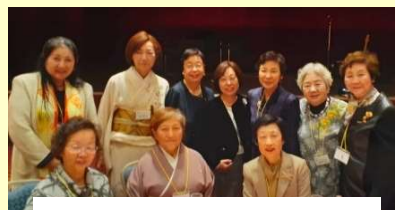
岐阜ゾンタクラブ 40周年にて