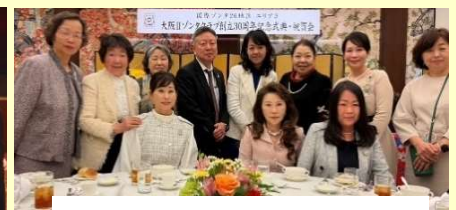
大阪IIゾンタクラブ 30周年にて