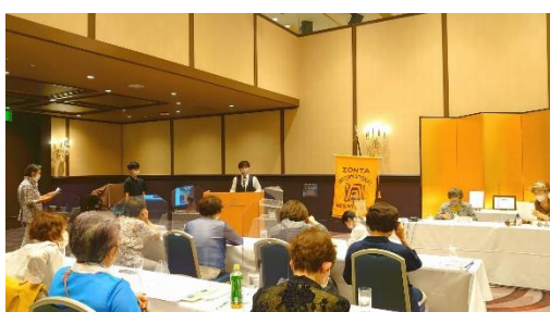
松本 ZC 7/21 松本大学 GZ 合同例会