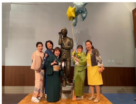
群馬 ZC 地区大会 Part2