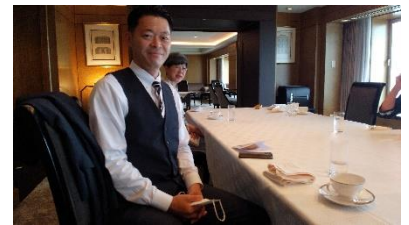
かながわゾンタボーイ