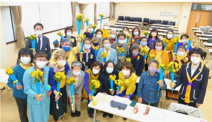
松本:ゾンタローズデー