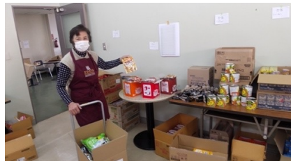
横須賀: フードドライブ事業