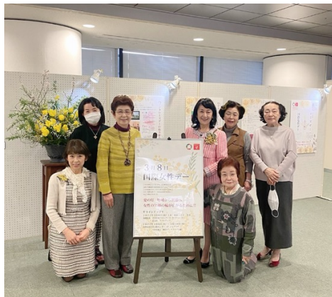
岐阜:ゾンタクラブ国際女性デー