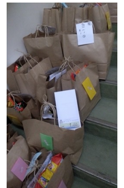
横須賀:フードドライブ 4