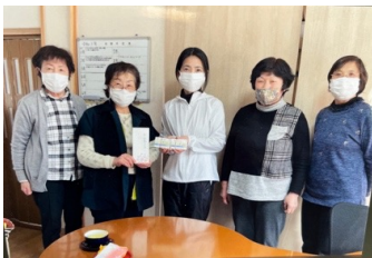
群馬: ヒトデプロジェクトクオカード進呈