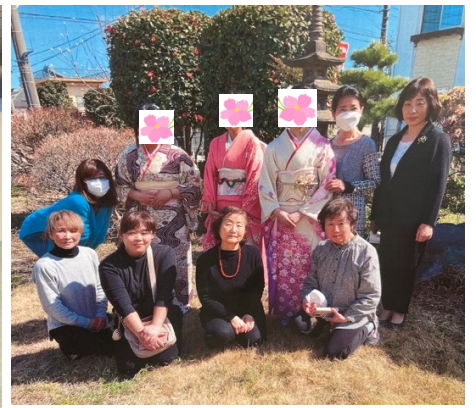
群馬:ローズイベント振袖着付け支援