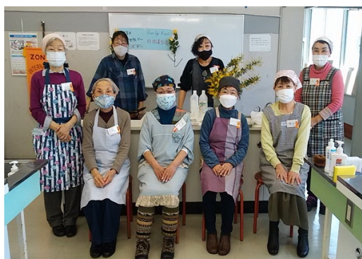
横須賀:ローズデー記念料理講習会