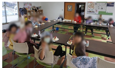
松本: 子ども食堂なみカフェ