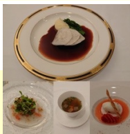
名古屋:東急ホテルコース料理