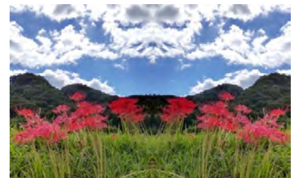
散歩道も秋の気配