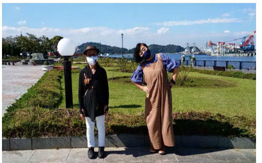
横須賀ZC 移動例会 ヴェルニー公園にて