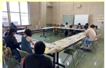
子供育成応援館 三重zc