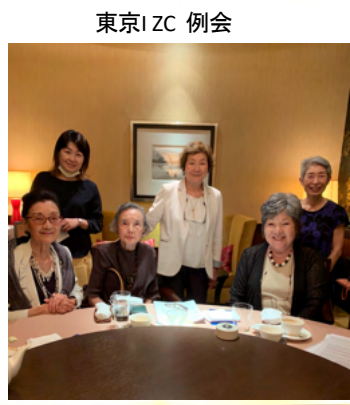
東京I ZC 例会