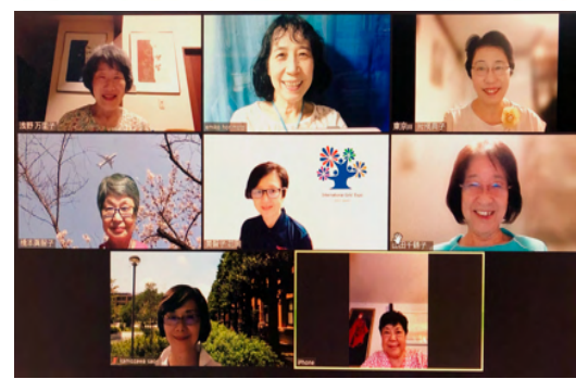
東京III ZC 例会

<東京IIIゾンタクラブ> 東京Iチャリティーバザーに出店予定 開催期間: 11月20日~東京Iに準ずる(会場又はオンライン) 物品内容: 利尻花折昆布(最上級品80g) 守口漬生ふりかけ等