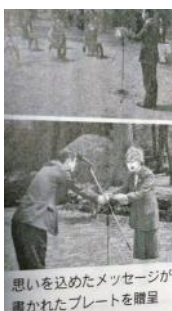
思いを込めたメッセージが 書かれたプレートを贈呈