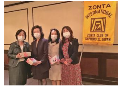
「4月例会でのお誕生日会」

北海道コロナ感染者が全国トップになった日もあり、5月例会は中止となりました。しかしながら4月例会では、徐々に会員のお顔を拝見でき、また活発な審議事項検討もなされ、「実際の例会は、やっぱり空気感が違います。一日も早く平穏な日々を取り戻せるよう皆で頑張りましょう」と思った次第です。