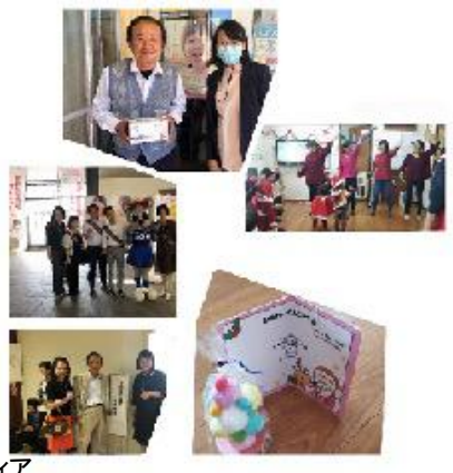
山梨:子供支援ボランティア