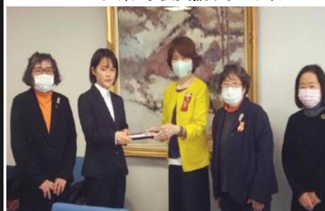
松本:修学支援金授与式