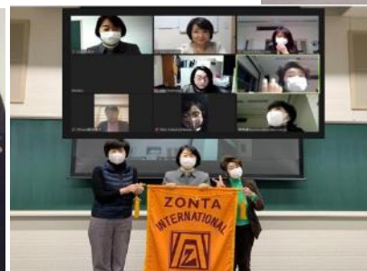
三重:第16回研修会(卓話)