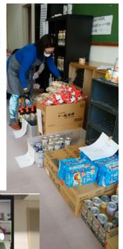
横須賀: 子育て支援 ジャガイモの 植え付け