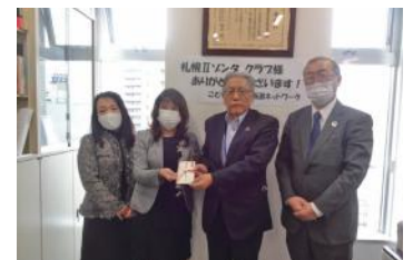
「子供食堂北海道ネットワーク」様に寄付金を贈呈

後日コロナ支援として「子供食堂北海道ネットワーク」「女性サポート Asyl」に寄付金をお渡し2020年の活動を締めくくりました。