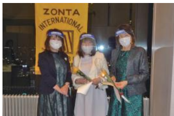
新入会員入会式 黄色いバラで歓迎