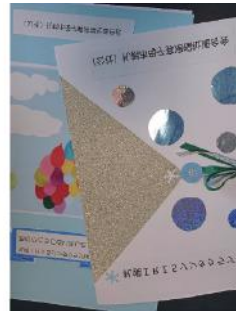
母子寡婦福祉連合会子供たちからのメッセージをもらいました