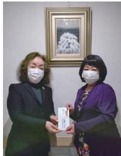
奉仕金贈呈：子ども食堂での学習支援に