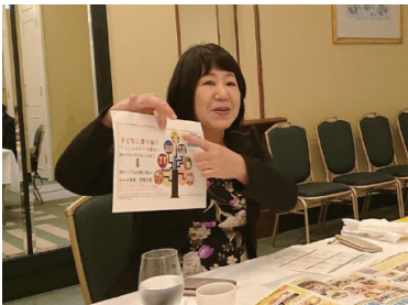
お話を聞き、子ども食堂に集まる子どもの学習支援を応援することとした