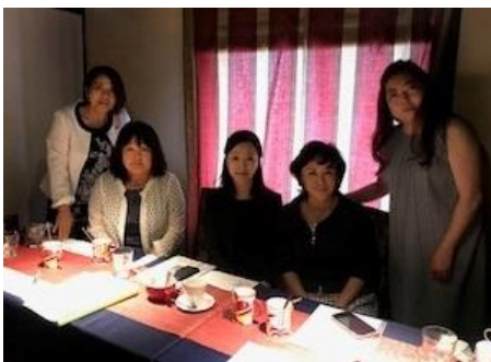
札幌 I ZC 移動例会