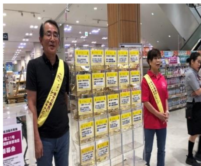
山形 ZC 黄色いレシート活動