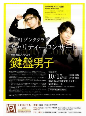
仙台 I ZC コンサート