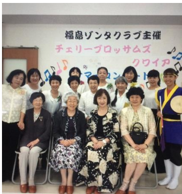
福島 ZC きらら訪問