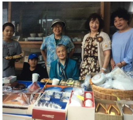
福島 ZC フリーマーケット