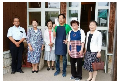
塩釜 ZC さくら学園に支援金